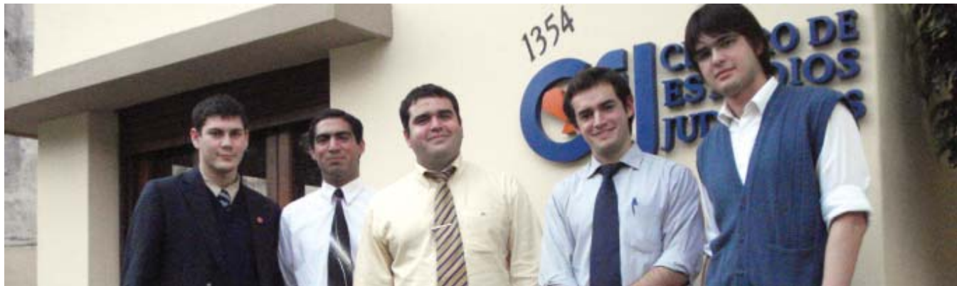
Lista independiente y Movimiento Podemos - UNA

Proponentes a llevar la voz de los estudiantes de derecho en el seno del Consejo Directivo de la Facultad.