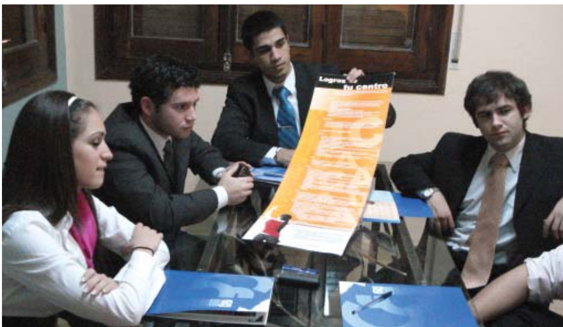
Movimiento Unidad Universitaria - UCA