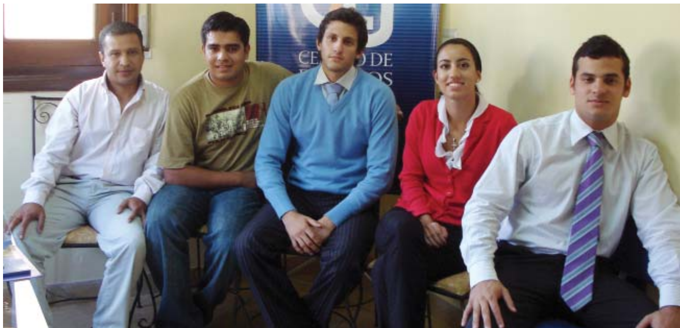
Movimiento Identidad · UCA

Proyectos e iniciativas para la campaña eleccionaria enfrenta dos listas tradicionales en la facultad de derecho de la Universidad Católica.